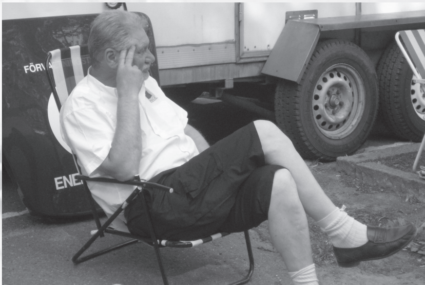
Funderar han på strategin?