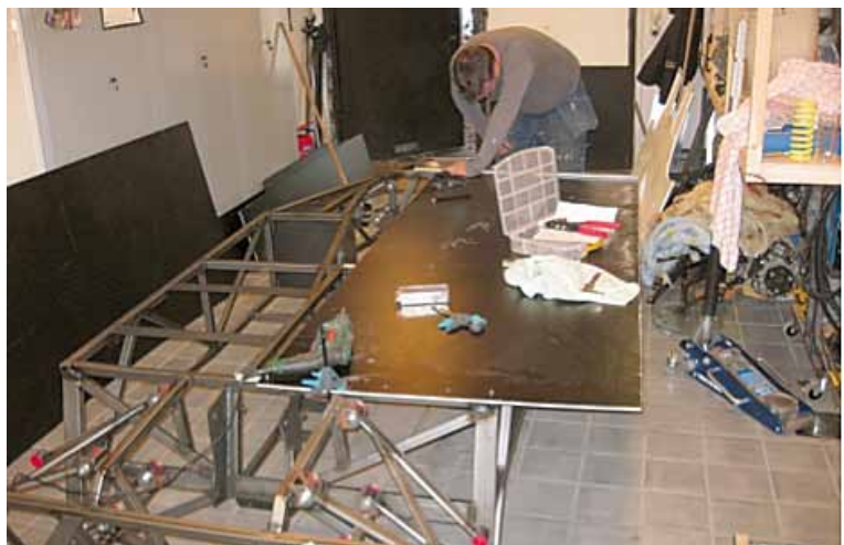
Konstruktion av golv