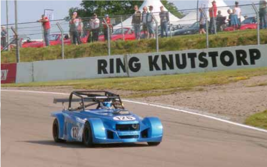
Lopp 13, Seven Racing, heat 1. Steffen Hansen (DK) Stuart Taylor Locoblade i utgången av NGK-krönet. Kom 3:a i båda heaten.

Under SSM 13 körde Per i de två heaten i lopp 12 GT/GTS – 1965, som i sin tur består av 7 olika klasser med bilar såsom Jaguar E-type, Austin Healey 3000, Lotus Elan, Ginetta G4, Ford GT 40 mm. Trots många potenta bilar kom Per på en 12:e resp. 14:e plats bland 23 startande bilar, vilket får anses vara ett bra resultat. Snabbaste varvtid 1:16,230.