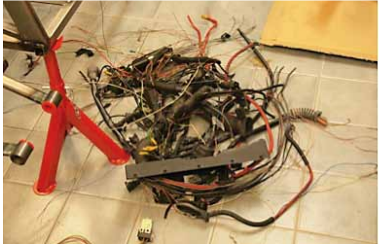
Lite kablar rensades bort

Nästa steg är att montera hjulupphängningar fram och bak tillsammans med broms- och fjädringskomponenter. Mer om detta i nästa artikel.