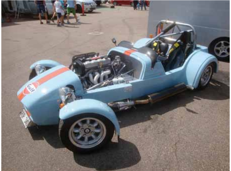
En snygg och välbyggd "7" i depån, dock ej tävlande i SSM.

däck, som klibbar fast på slitbanorna och kan förorsaka våld-samma vibrationer. Vanligt att man får ägna sig åt att skär bort slitbaneresterna efter varje race.