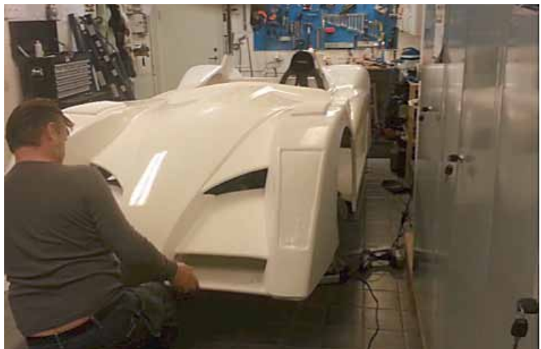
Inpassning av kaross