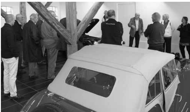
En utmärkt mötesplats för bilgöttegrisar.