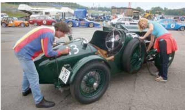
En del gör det på originalvis, d.v.s målar nummer för hand.