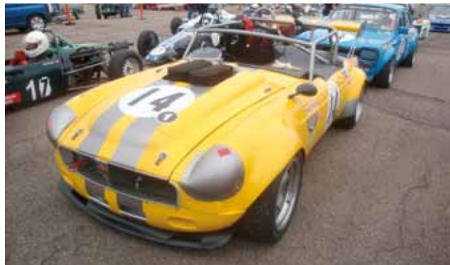
Line up i den s.k open pit lane under den fria träningen. Två rader av bilar, med resp. utan kaross, som körde växelvis i 20 minuters-pass.