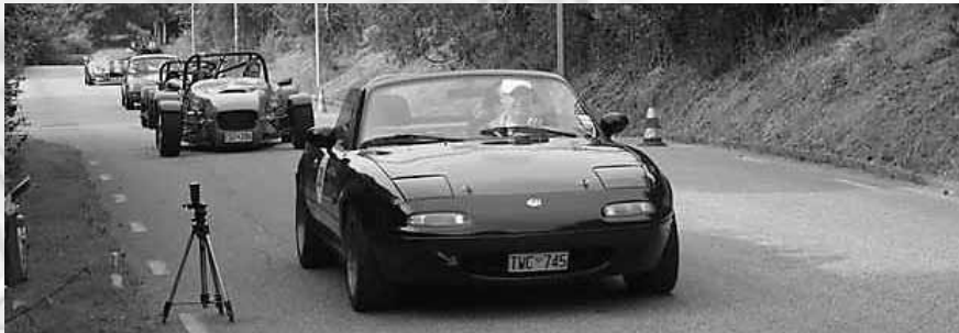
Provkörning uppför backen.