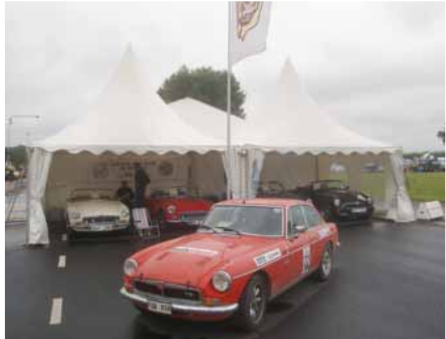
MGCC:s utställning av den 50-års jubilerande MGB, 4st roadster från olika tidsepoker samt en MGB GT V8.

Nytt för i år var användning av ett system med ljusskyltar i st.f. flaggor.