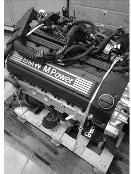
Kusar från Bayern!

När jag slutligen var färdig blev jag ändå inte nöjd med vikten som jag tyckte inte lämpade sig för en racerbil. För en gatbil är det kanske önskvärt med en grov rörram men inte för en racerbil. Jag beslutade därför