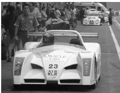
En Batmobile i depån?

För några år sedan byggde jag en "sjua" av märket Westfield. Den färdigställde jag på åtta månader från det att chassi och kaross kom från England tills den var besiktigad och klar. Det var härligt att ha ett pågående projekt i garaget och jag hade saknat den känslan efter att den blivit klar. Visserligen hade jag genomfört vissa uppdateringar varje år och sannolikt kommer den aldrig bli klar utan det finns alltid saker att förbättra. Men jag hade helt klart saknat känslan av att ha ett byggprojekt på gång. Jag kontaktade därför säljaren och åkte och tittade. I korthet kan bilen beskrivas som en "Sjua" med heltäckande kaross. Motorn sitter i fram varför motorhuvu blir väldigt lång. Framifrån ser den ut som en batmobile. Den