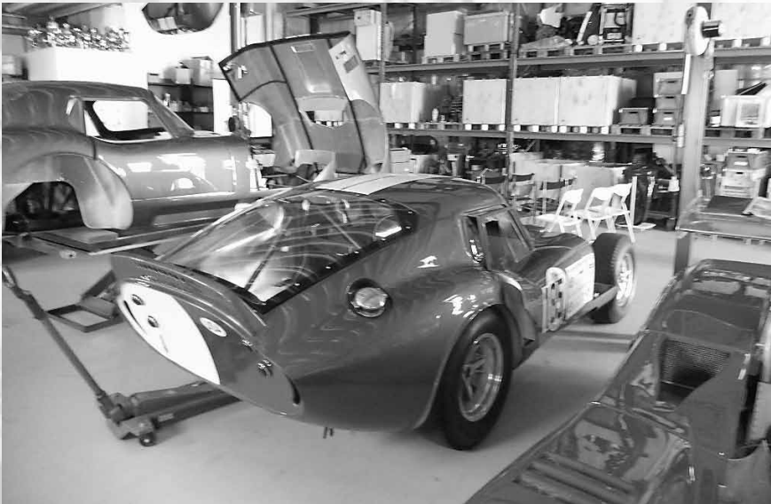
Skönheter på rad.