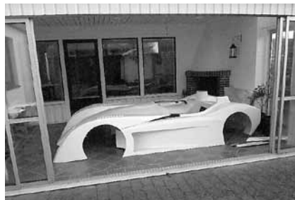
Älskling, det är någon som parkerat i uterummet!

är extremt designad med splitter och venturitunnel samt flänsar över framskärmarna. Jag tilltalades av konstruktionen och designen. Projektet var påbörjat i så motto att man hade förstärkningssvetsat ramen och gjort motorfästen. Det följde också med lite godsaker som gjorde det lättare att ta ett köpbeslut, bl.a. HiSpec bromsok både fram och bak.