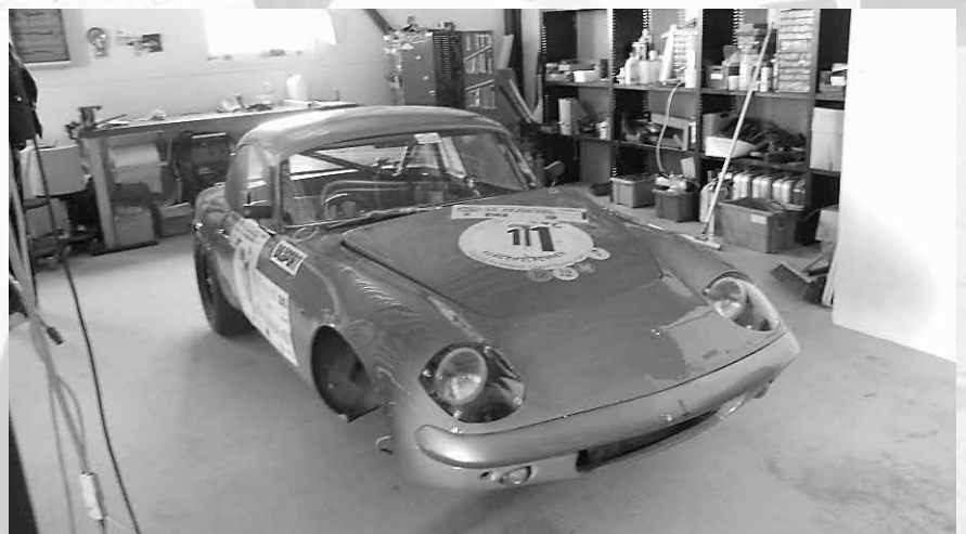
Gammal övergiven trotjänare?

Vi i MSCC tackar Thomas för en lyckad dag med mycket däckssparkande och bilsnack.