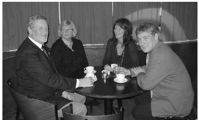
Nog sitter glorian lite på sned...