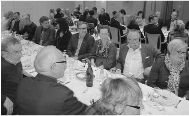
JR och SR.