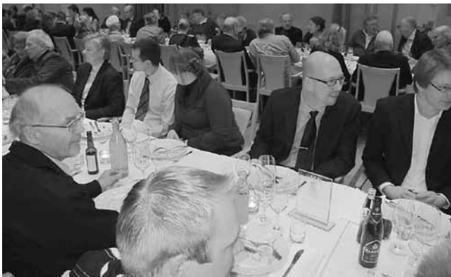
På en tennismatch, men var é bollen?