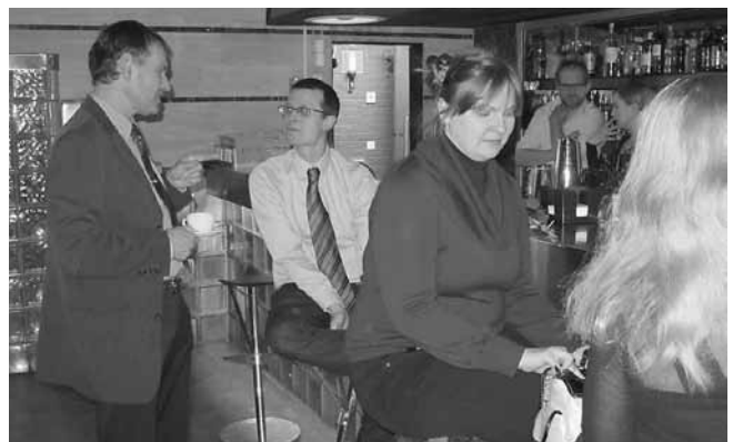
O du, ingen C-bil kör om mig...aldrig.