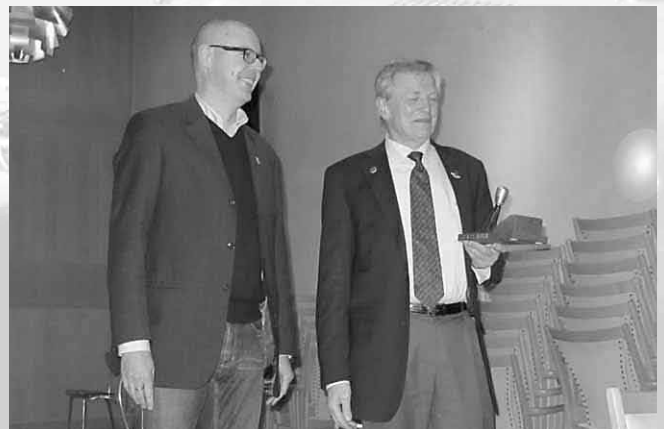
2011-års MSCC-medlem, ...till höger.