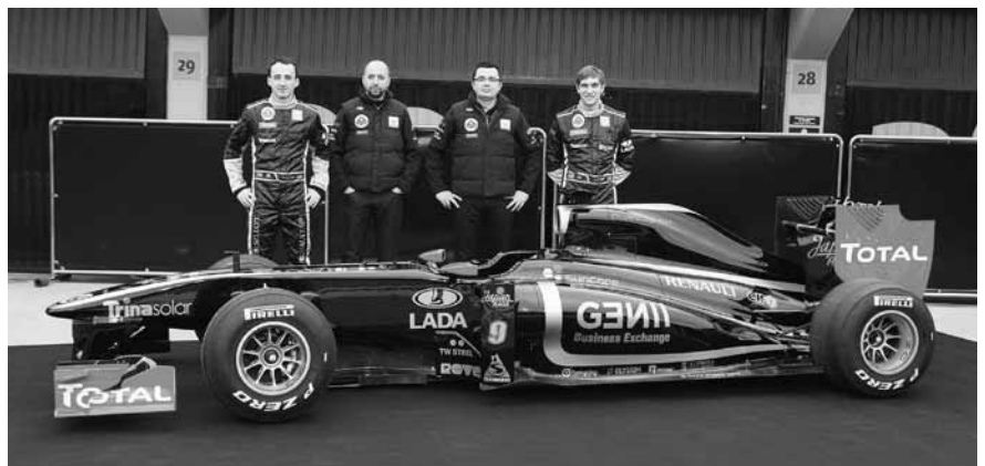
Lotus-Renault F1 2011.