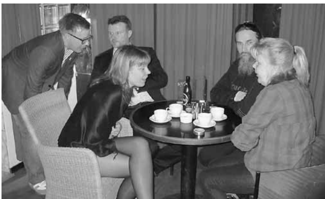
Sssch, jag har köpt en ny bil, igen!