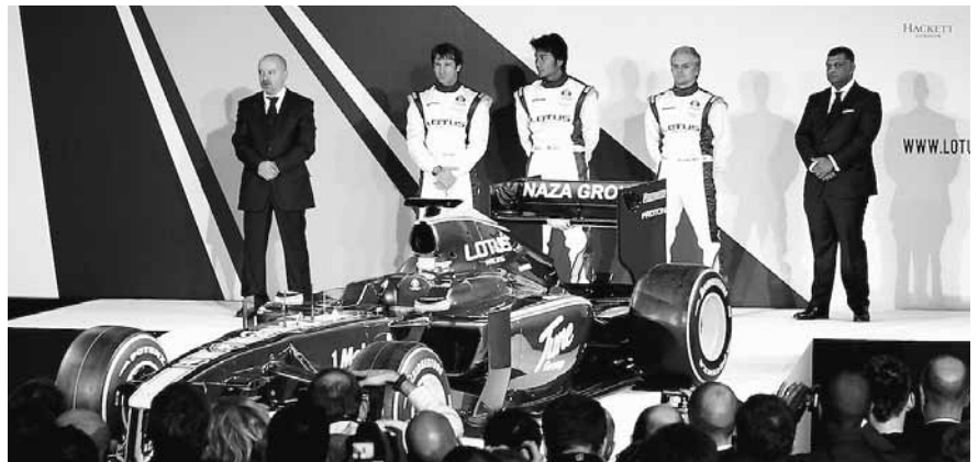
Lotus F1 2010.

Lotus Renault GP. Förare var Robert Kubica och Vitaly Petrov, färgschemat var också klassiskt för Lotus, svart och guld. Kubica hade tyvärr en otrevlig olycka i rally och håller på att träna