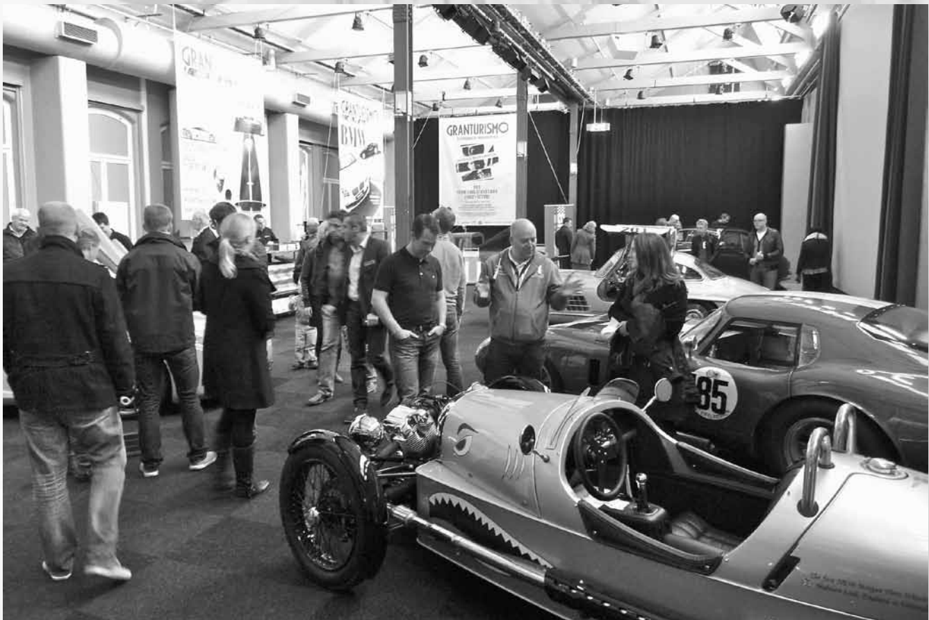
Gran Turismos egna hall med en ny Morgan 3-wheeler i förgrunden.