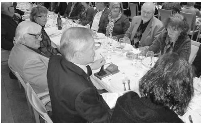
Självklart växlar en anglofil med vänster hand.