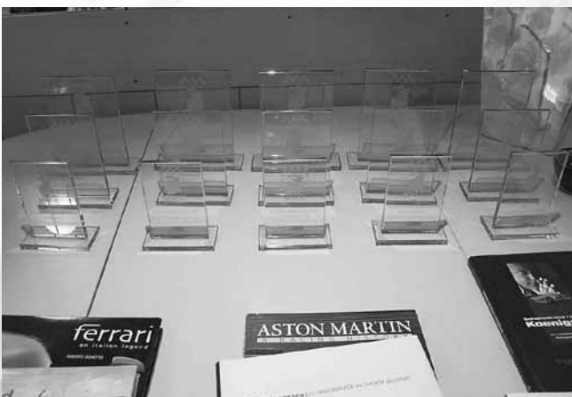
Nya snygga KM-priser.