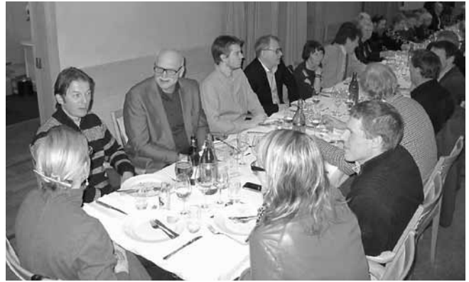
Några av sjunde-klassarna.