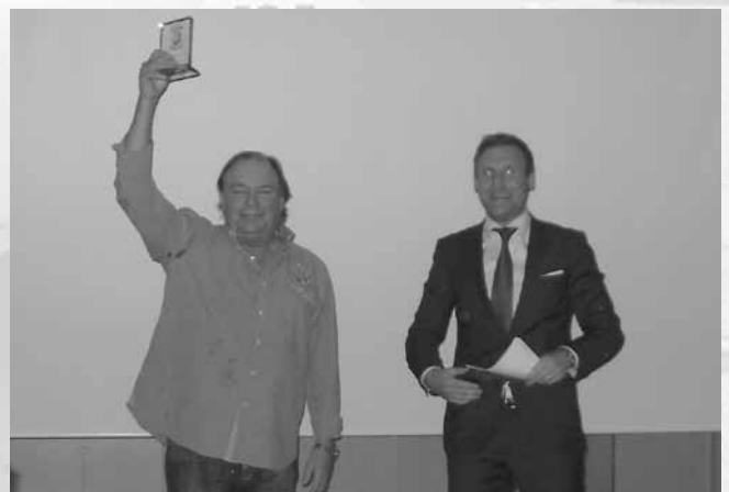
En glad motionär.