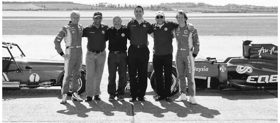
Team Lotus köper Caterham 2011.