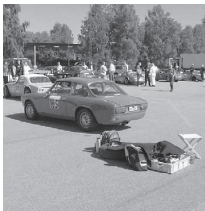
Christian Almström, Alfa Romeo GTV 2000

paren, doftar inte lavendel inne i bilen. Banans utformning och beläggning fick ett gott betyg av de tävlande. Undantaget var möjligen den första högerböjen och efterföljande raksträcka, strax efter start och mål. En mycket intressant del av banan, i alla fall sett ur åskådarnas synvinkel. Valde man som förare att i utgången på högerkurvan lägga sig i vänsterspåret längs rakan så fick man akut beslutsångest i valet mellan njurväls och åksjuketabletter. Detta avsnitt av banan förde nämligen tankarna till en väl preparerad puckelpist. Under senare delen av eftermiddagen, då tävlingarna var avslutade, gavs det tillfälle att prova banåkning i lite lugnare tempo för dom som så önskade. Under eftermiddagen