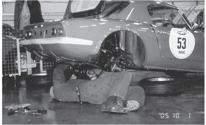
Thomas nybyggda Elan fungerade fint efter att BG skruvat mycket i bakvagnen.