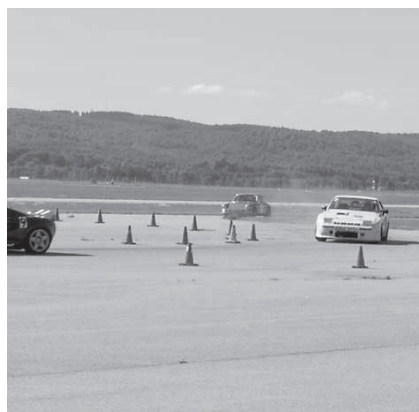
Pär Hylander, Porsche 924 T