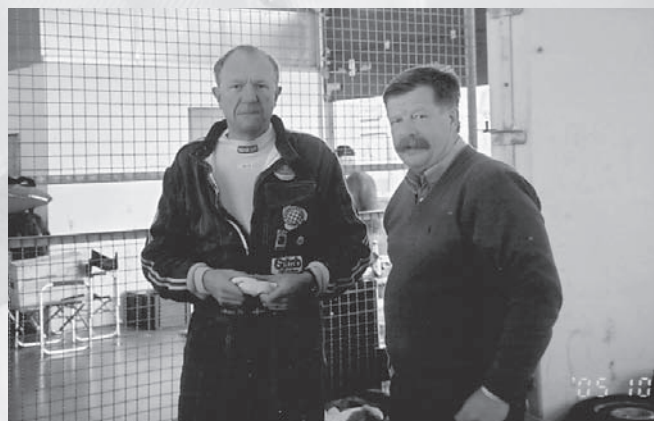
Faan, va halt det är!