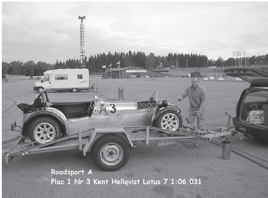
Roadsport A Plac 1 Nr 3 Kent Hellqvist Lotus 7 1:06.031