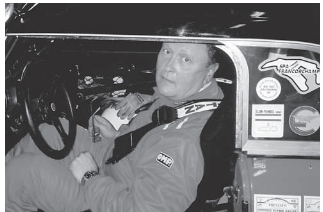
"Räcker strömmen nu pojkar?"