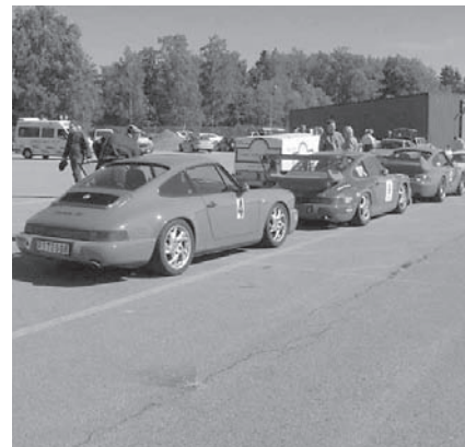
Line-up Roadsport A

tycke bra beslut från tävlingsledningen, som kanske även kunde praktiseras vid KM på Knutstorp och Sturup. Historic klassen var dock inte lika väl representerad med 6 st deltagare (3 utom tävlan) här tycks kvaliteten gå före kvantiteten, eller vad sägs om en Ferrari Dino 206S. RS och Roadsport A hade 6 resp. 9 deltagare. Att tävlingen kördes den 3 september, verkade närmast osannolikt, med tanke på den rådande sommarvärmen. Kanske lite kompensering för första årets ihärdiga regnande.