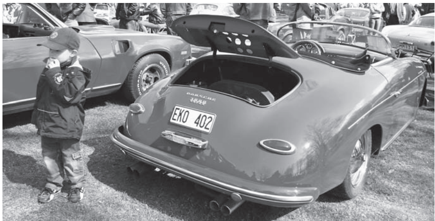
En så´n skulle man kanske skaffa sig...? Om Porsche-speedstern är original eller replika spelar ingen roll, läcker är den oavsett vilket!