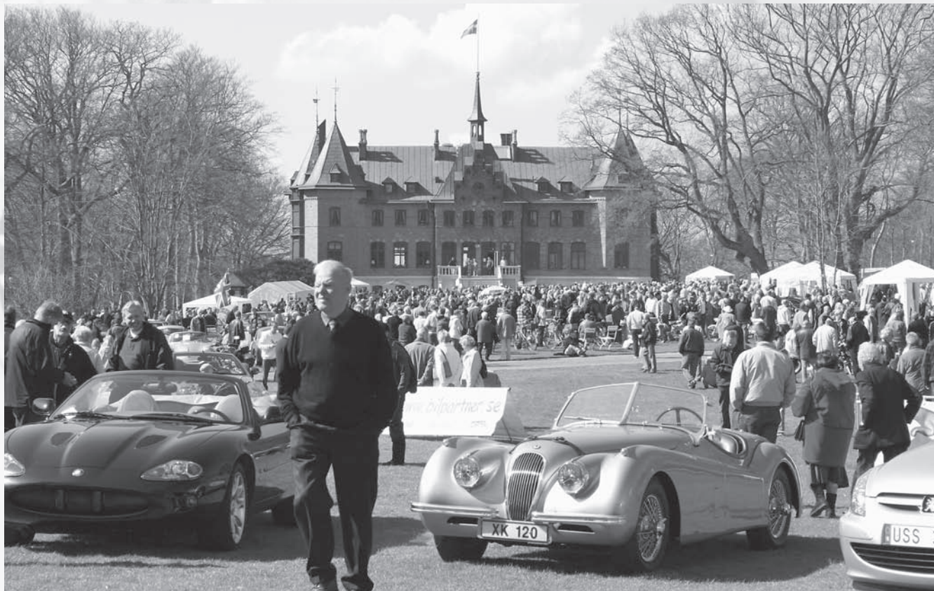
En ståtlig syn möte besökarna på det första Sofiero Classic: Ett slott, massor med fordon & folk och en Jaguar XK120 i frontledet.

Den första utgåvan av Sofiero Classic är över, drygt 7 000 njöt av mer än 350 fordon i ett strålande vårväder söndagen den 24 april. Vi i MGCC var givetvis med, men inte bara som utställare utan även som arrangörer. Tillsammans med motorcykelentusiasterna i MCHK (Motorcykelhistoriska Klubben) och MCV (Club MC-Veteranerna) samt Sofiero Slott tog vi steget och satsade på något nytt: en vårsalong för alla sorters öppna fordon! Eller lite mer detaljerat; fascinerande velocipeder, knattrande mopeder, fartfyllda motorcyklar, potenta sportvagnar och läckra cabrioletter. En blandning som visade sig gå hem såväl hos utställare som hos publiken.