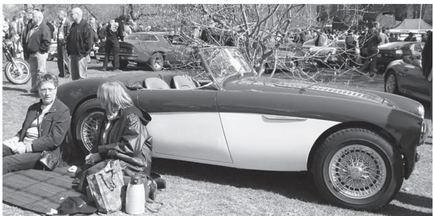
När våren är som bäst: sol och en öppen engelsk sportvagn! Picknicklägen vid Austin-Healeyn.